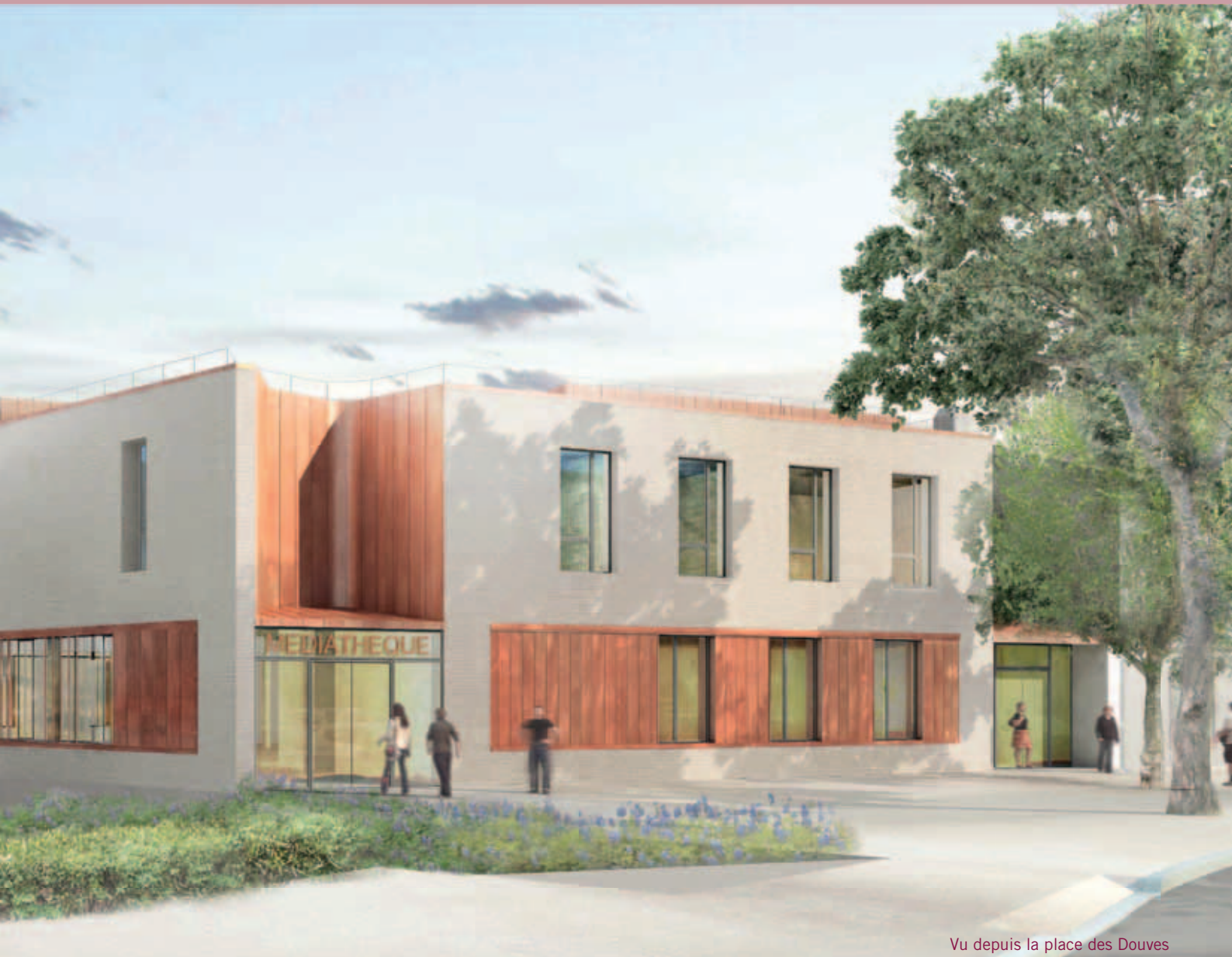
Vu depuis la place des Douves