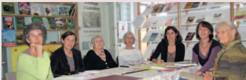
▲ L'équipe d'animation

En quoi, pour votre association, la médiathèque est-elle importante ? Les locaux actuels sont très exigus, ils sont constitués de plusieurs petites salles et d'une véranda. La quantité de livres est devenue très importante au fil des années, et on manque cruellement de place ; de plus, les bénévoles font des efforts d'animation en direction des enfants notamment, mais les locaux ne s'y prêtent pas du tout. Comme une médiathèque est «en projet» depuis bientôt 8 ans, l'informatisation n'a pas été faite, ce qui est un handicap pour la gestion. Un équipement nouveau, fonctionnel et moderne, attirera de nouveaux usagers, notamment toutes les familles qui vont actuellement dans les médiathèques des environs, faute de trouver dans leur ville l'équipement qu'elles attendent ; cela dynamisera aussi l'équipe de bénévoles.