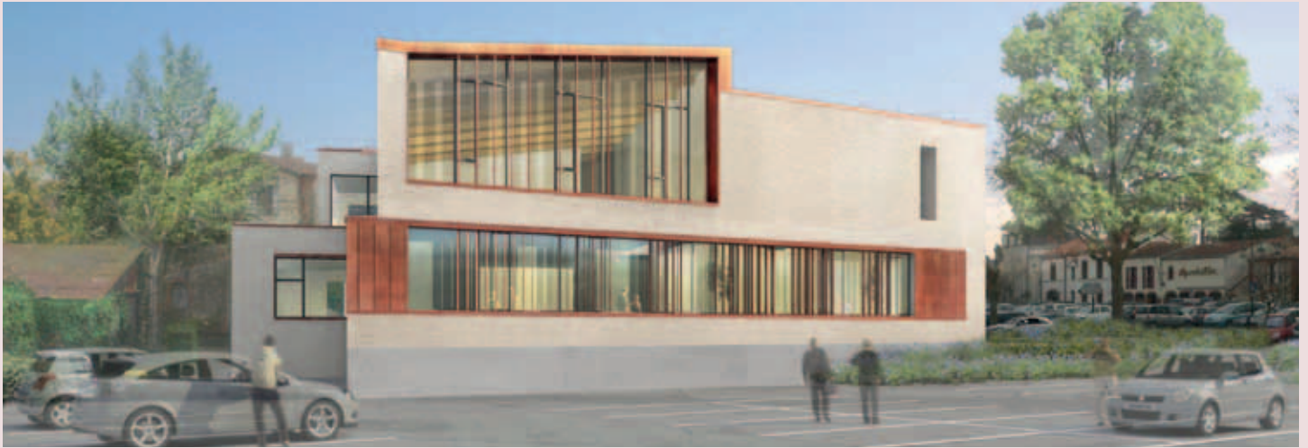
▲ Médiathèque et Cercle Olivier de Clisson depuis la place Jacques Demy

Attendue depuis longtemps, promise par certains mais toujours reportée, la médiathèque de Clisson ouvrira ses portes dans deux ans. Mais que sera cette médiathèque, que contiendra-t-elle, à qui s'adresse-t-elle ? Revue de détails du futur équipement.