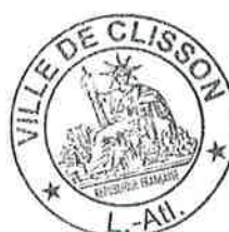
Tableau du Conseil municipal Procès-verbal de l'élection du Maire et des adjoints.