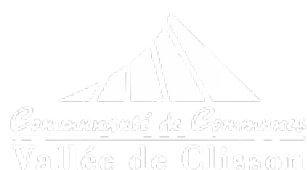
Schéma de Cohérence Territoriale (SCoT) du Pays du Vignoble Nantais