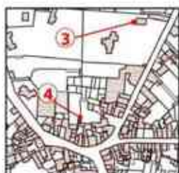
3 Quercus suber 31 Rue de la Dimerie

Ces deux arbres appartiennent à des propriétaires privés