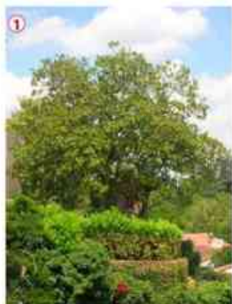
① 2 Magnolia grandiflora 1 Rue du Minage

Objectif : Valoriser et protéger des spécimens isolés tout à fait remarquables.