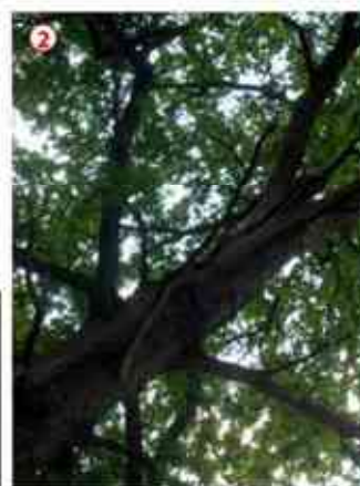
② Vieux chêne E337-E342

Ces deux superbes spécimens ont été plantés sur une propriété privée, près du château.