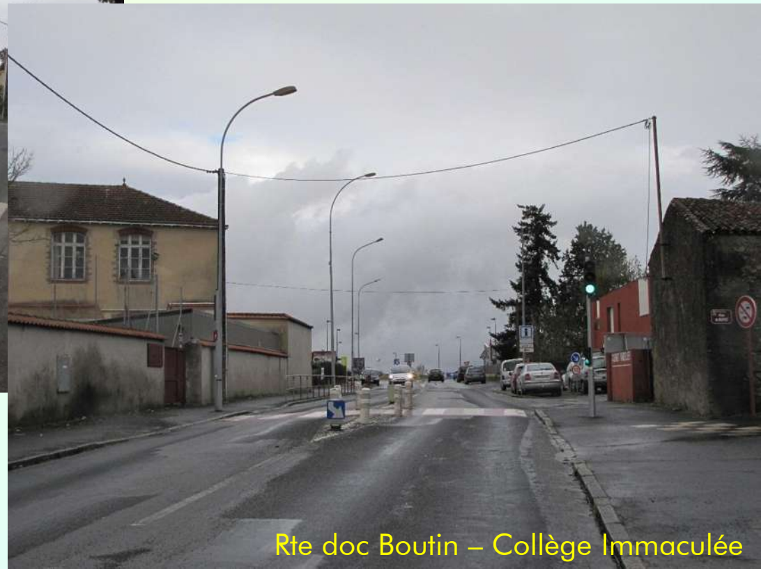
Rte doc Boutin – Collège Immaculée